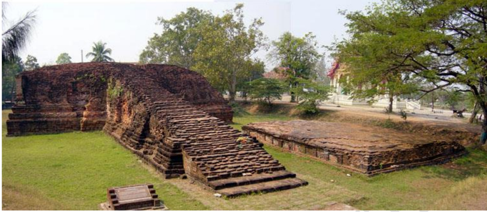
วัดโขลง โบราณสถานกลางเมืองคูบัว อ.เมือง จ.ราชบุรี